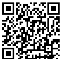
きゅうあーる [Q R コード]